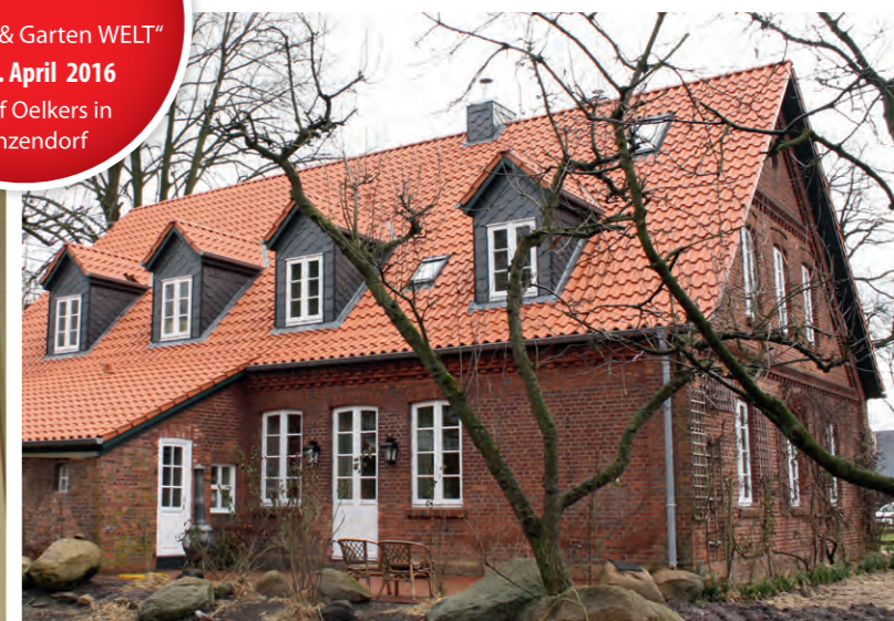
BauRaum: Charme und Stil blieben bei dem alten Haus erhalten