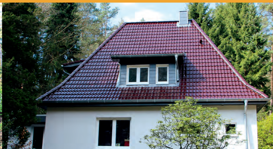
BauRaum: Vom Altbestand zum Neubau –